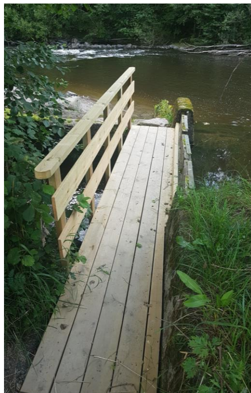
Fig 1: Nye brua til Grøttedammen! Arbeidet utført av Leif Erik Horn.