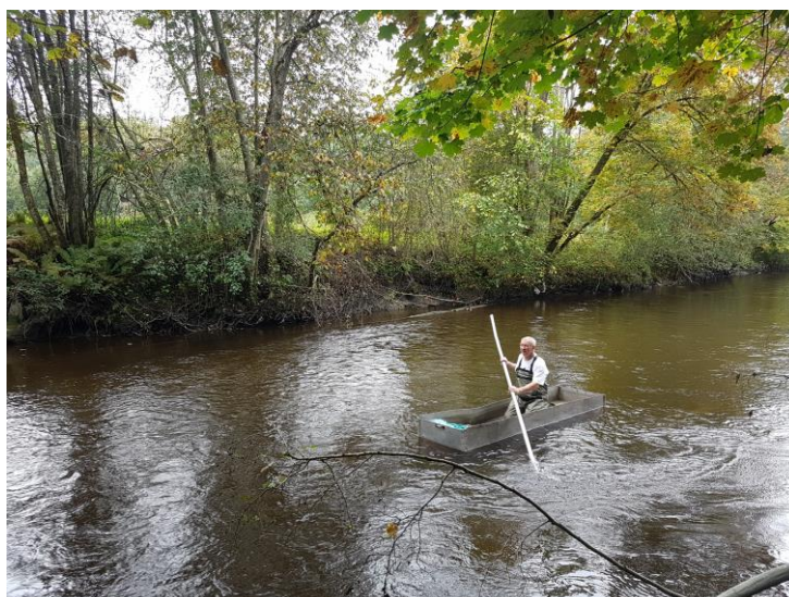
Fig 4: Stamfiske ovenfor Sjymasjerudhølen.