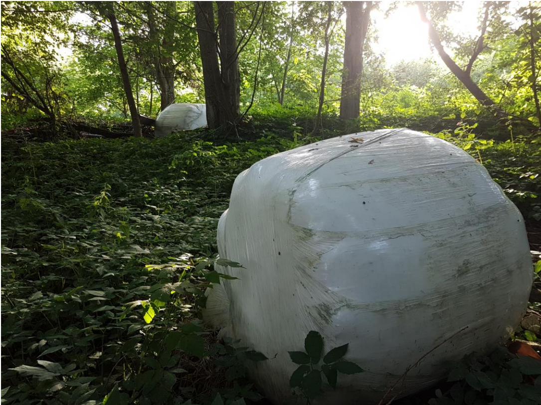
Fig 6: 2024 ble året da Lierelva fikk nasjonal oppmerksomhet som «Norges mest forurensede» elv. Det ble beregnet 1 meter plast per meter elv. I reportasje NRK 9.august 2024 skrives: – «I Lierelva er det flere elvestrekninger som nesten ikke har plast. Men så kommer man til noen utsatte steder. Det ser ut som det er landbruksplast som er skjøvet ut fra jordbruksarealer og rett ut i elva. Der er det altså store fyllinger som kun består av plast».