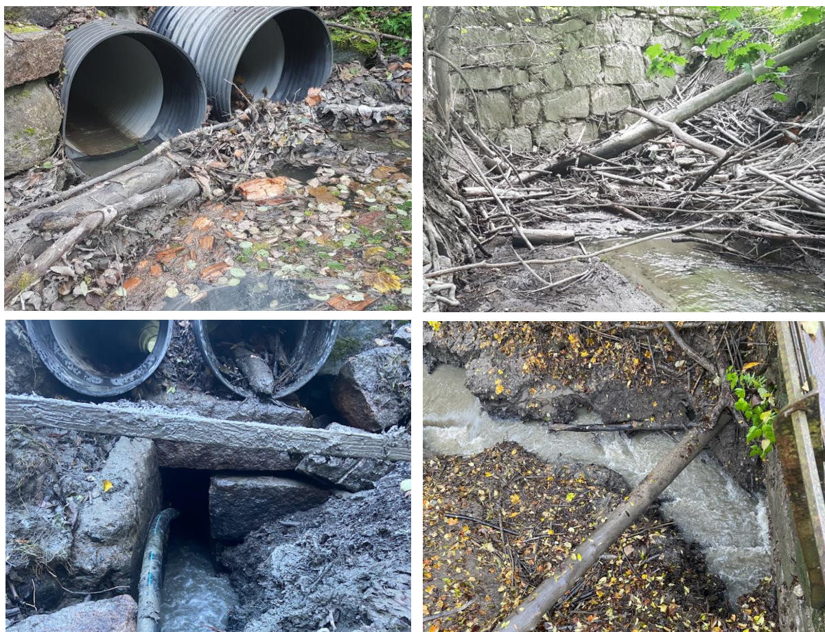
Fig 5 Kulverter i Øksne (venstre) og Berfløttbekken før (øverst) og etter rydding (nederst).